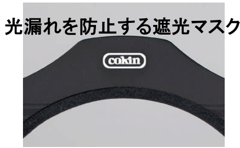
光漏れを防止する遮光マスク