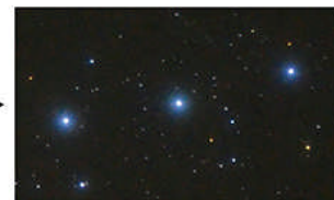
プロソフトン (A) 使用