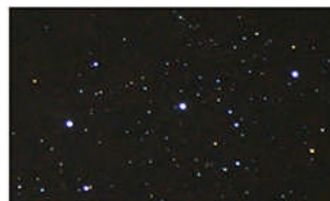
フィルター未使用